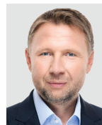
Marcina Kierwińskiego, Ministra Spraw Wewnętrznych i Administracji