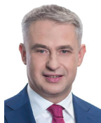
Krzysztofa Gawkowskiego, Wicepremiera, Ministera Cyfryzacji