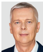
Tomasza Siemoniaka, Ministra - Członka Rady Ministrów, Koordynatora Służb Specjalnych