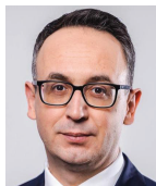
Dariusza Klimczaka, Ministra Infrastruktury