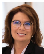
Małgorzaty Kidawy-Błońskiej, Marszałek Senatu